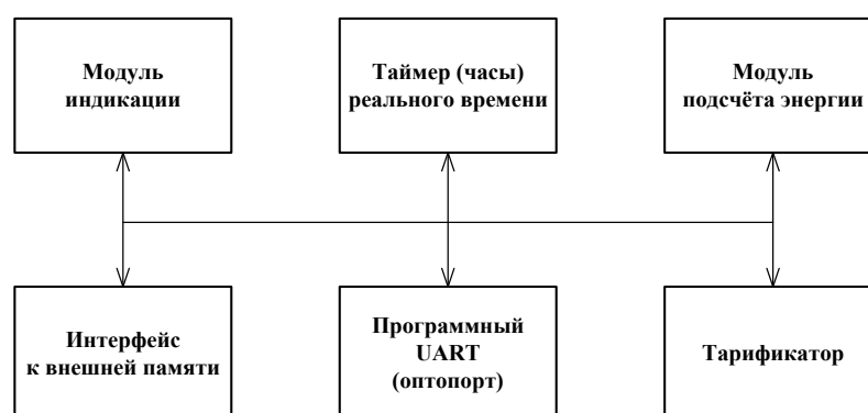
Рисунок 4 - Структура программного обеспечения «Меркурий 236»

Идентификационные данные программного обеспечения приведены в таблице 4.