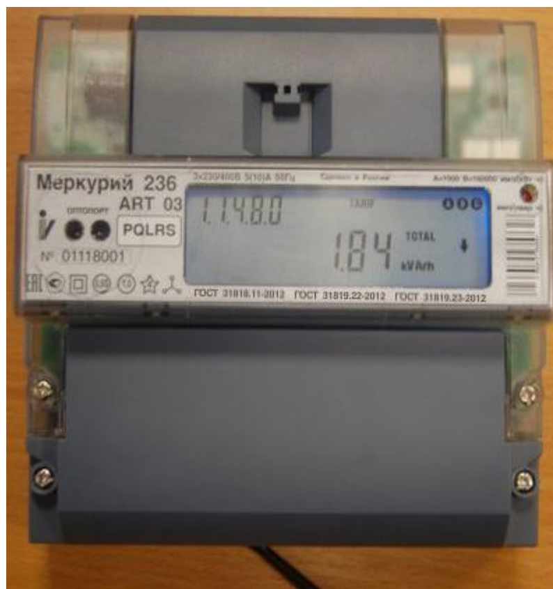
Рисунок 2 – Внешний вид счётчиков «Меркурий 236А(Р)(Т)...»

На рисунке 2 приведена фотография общего вида счётчиков «Меркурий 236А(Р)(Т)...».