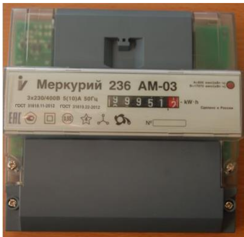
Рисунок 1 – Внешний вид счётчиков «Меркурий 236АМ-0Х»

Счётчики с жидкокристаллическим индикатором (ЖКИ) являются многотарифными и выпускаются с внешним или внутренним тарификатором и предназначены для учёта активной энергии прямого направления или активной энергии прямого направления и реактивной энергии прямого и обратного направления (таблица 2)