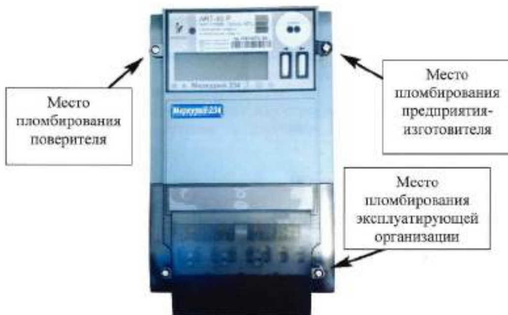
Рисунок 3 – Общий вид счетчиков модификаций «Меркурий 234» и «Mercury 234» с указанием мест пломбирования и нанесения знака поверки