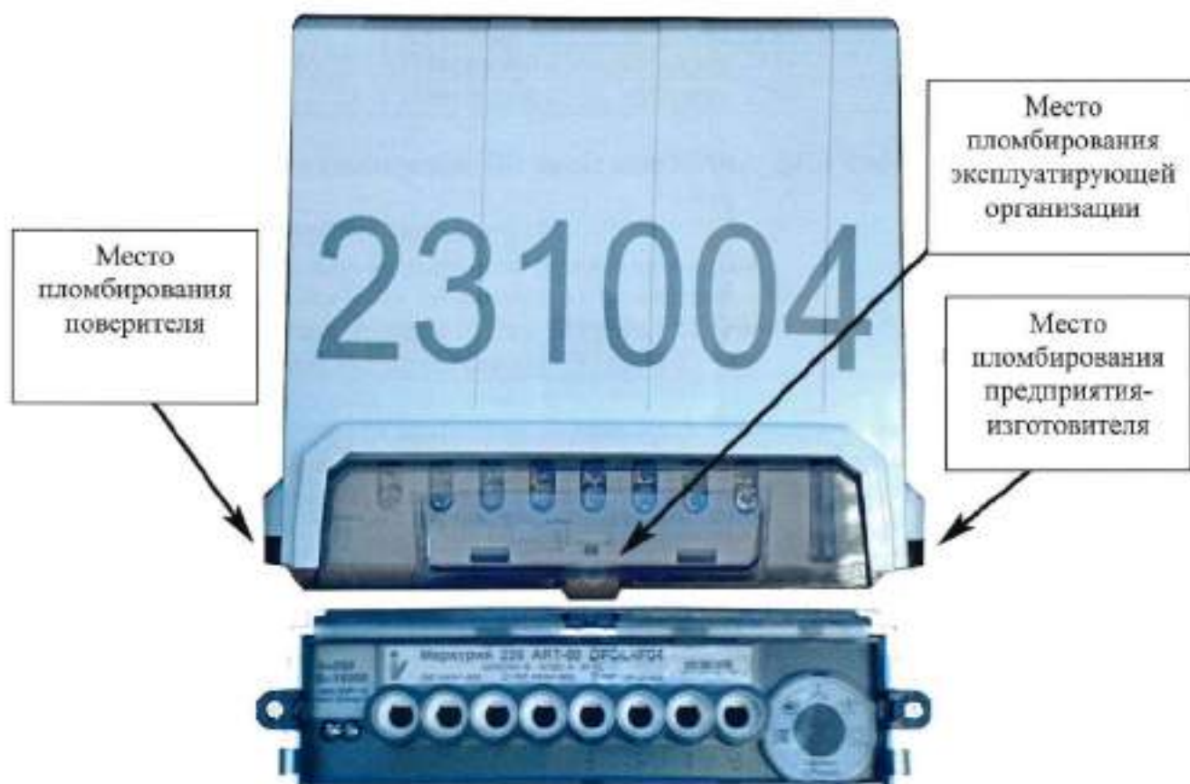
Рисунок 4 – Общий вид счетчиков модификаций «Меркурий 238» и «Mercury 238» с указанием мест пломбирования и нанесения знака поверки