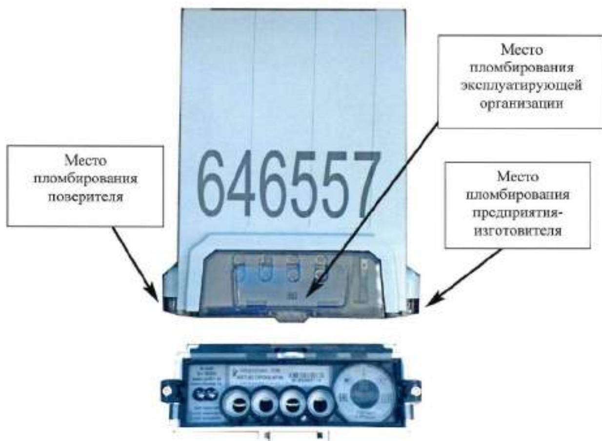
Рисунок 2 – Общий вид счетчиков модификаций «Меркурий 208» и «Mercury 208» с указанием мест пломбирования и нанесения знака поверки