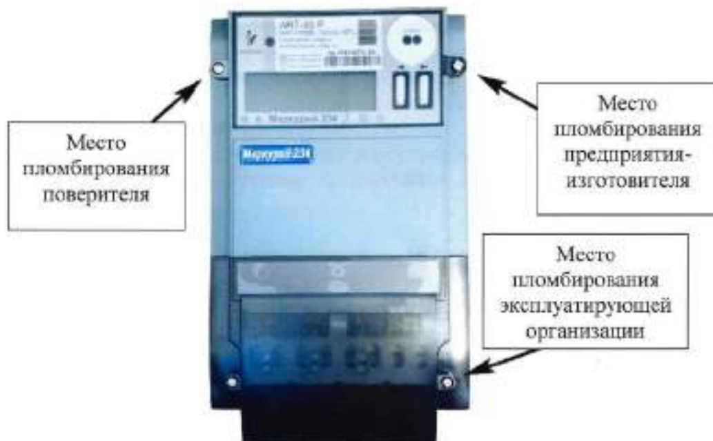
Рисунок 3 – Общий вид счетчиков модификаций «Меркурий 234» и «Mercury 234» с указанием мест пломбирования и нанесения знака поверки