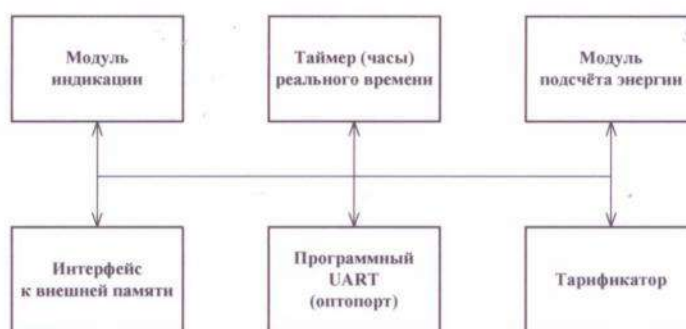
Рисунок 3 - Структура программного обеспечения «Меркурий 230»

Уровень защиты программного обеспечения от непреднамеренных и преднамеренных изменений «высокий» в соответствии с Р50.2.077-2014.