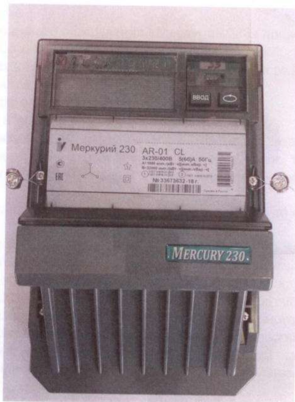
Рисунок 1 - Общий вид счетчика

Схема пломбировки от несанкционированного доступа, обозначение места нанесения знака поверки представлены на рисунке 2.