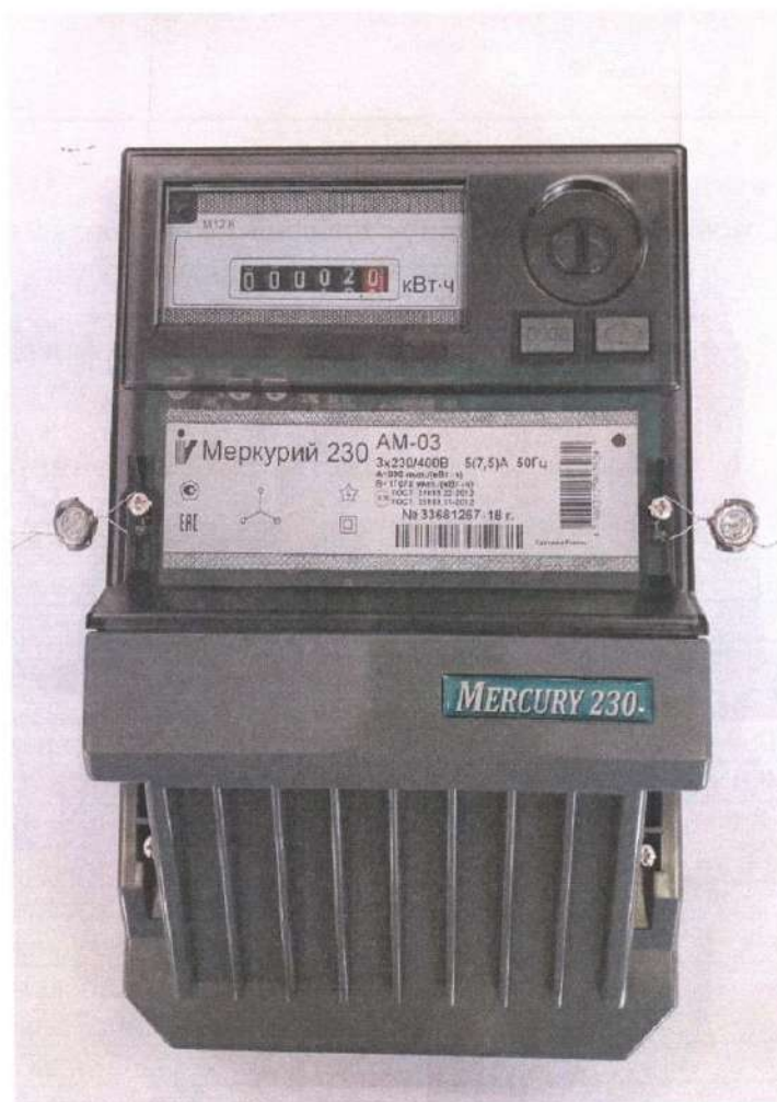
Рисунок 1- Общий вид счетчика с закрытой клеммной крышкой

Общий вид счётчиков электрической энергии трёхфазных статических «Меркурий 230АМ» представлен на рисунке 1.