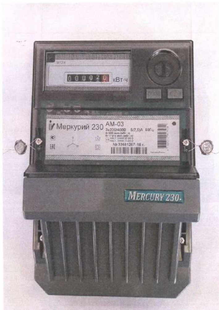
Рисунок 1- Общий вид счетчика с закрытой клеммной крышкой

Общий вид счётчиков электрической энергии трёхфазных статических «Меркурий 230АМ» представлен на рисунке 1.