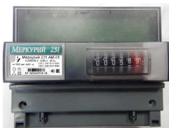
Рисунок 1 - Общий вид счетчика электрической энергии трехфазного статического «Меркурий 231АМ-01»

Общий вид счетчика электрической энергии трехфазного статического «Меркурий 231АМ-01» представлен на рисунке 1.