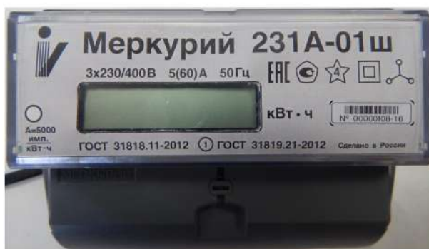
Рисунок 3 - Общий вида счетчика электрической энергии трехфазного статического «Меркурий 231А-0Хш»

Общий вида счетчика электрической энергии трехфазного статического «Меркурий 231А-0Хш» представлен на рисунке 3.