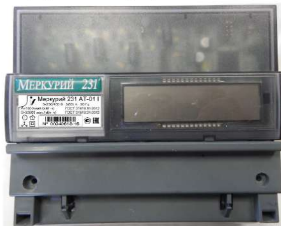
Рисунок 4 - Общий вида счетчика электрической энергии трехфазного статического «Меркурий 231А(Р)(Т)-0Х»

Общий вида счетчика электрической энергии трехфазного статического «Меркурий 231А(Р)(Т)-0Х» представлен на рисунке 4.