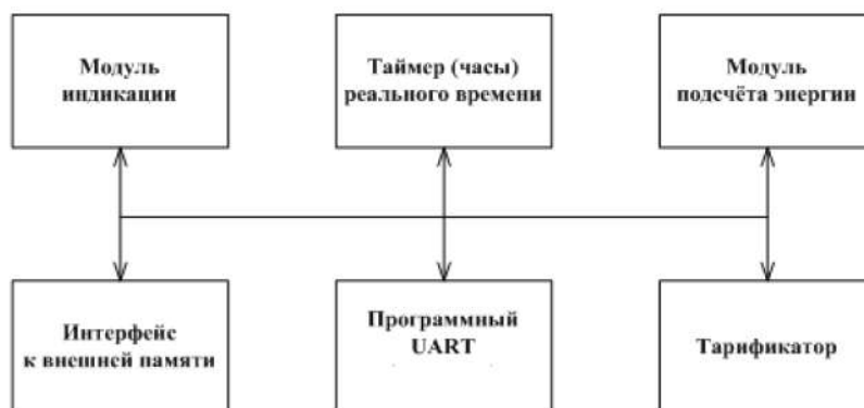
Рисунок 7 - Структура программного обеспечения «Меркурий 231»

Уровень защиты программного обеспечения «высокий» в соответствии с Р 50.2.077-2014.