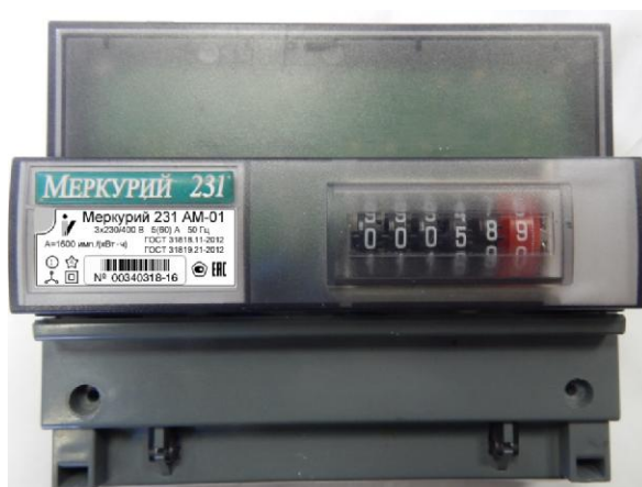
Рисунок 1 - Общий вид счетчика электрической энергии трехфазного статического «Меркурий 231АМ-01»

Общий вид счетчика электрической энергии трехфазного статического «Меркурий 231АМ-01» представлен на рисунке 1.