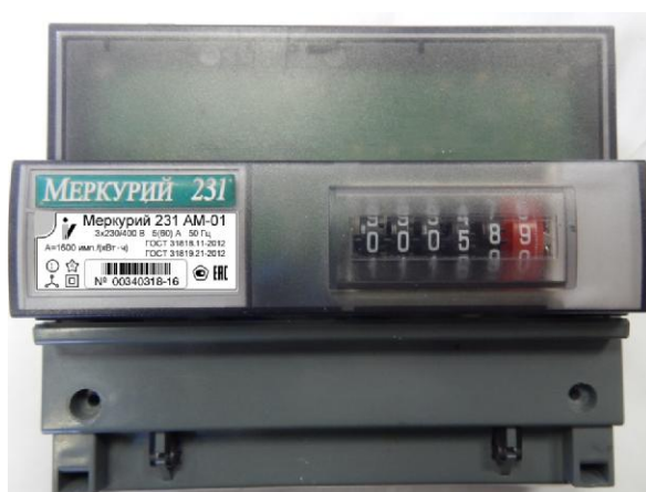
Рисунок 1 - Общий вид счетчика электрической энергии трехфазного статического «Меркурий 231АМ-01»

Общий вид счетчика электрической энергии трехфазного статического «Меркурий 231АМ-01» представлен на рисунке 1.