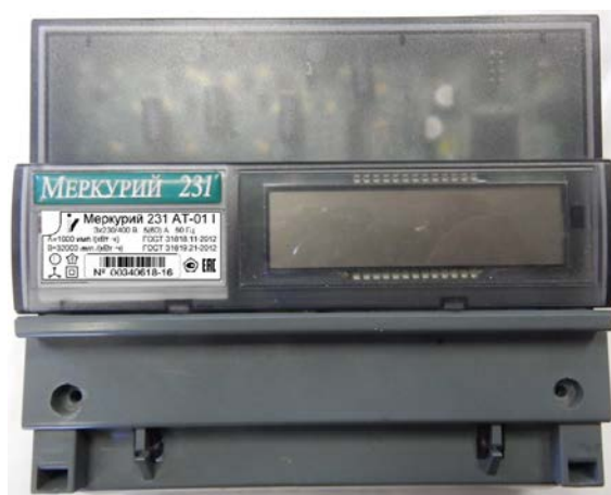
Рисунок 4 - Общий вида счетчика электрической энергии трехфазного статического «Меркурий 231А(Р)(Т)-0Х»

Общий вида счетчика электрической энергии трехфазного статического «Меркурий 231А(Р)(Т)-0Х» представлен на рисунке 4.