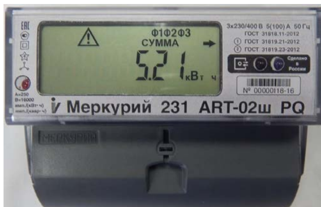
Рисунок 5 - Общий вид счетчика электрической энергии статического трехфазного «Меркурий 231А(Р)Т-0Хш»

Схемы пломбировки от несанкционированного доступа, обозначение места нанесения знака поверки представлены на рисунке 6.