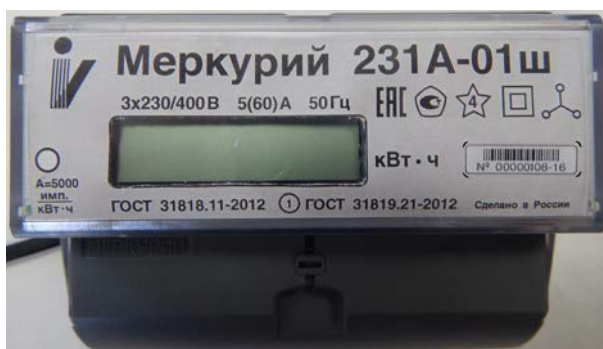
Рисунок 3 - Общий вида счетчика электрической энергии трехфазного статического «Меркурий 231А-0Хш»

Общий вида счетчика электрической энергии трехфазного статического «Меркурий 231А-0Хш» представлен на рисунке 3.