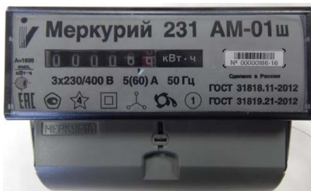
Рисунок 2 - Общий вида счетчика электрической энергии трехфазного статического «Меркурий 231АМ-0Хш»

Общий вида счетчика электрической энергии трехфазного статического «Меркурий 231А-0Хш» представлен на рисунке 3.