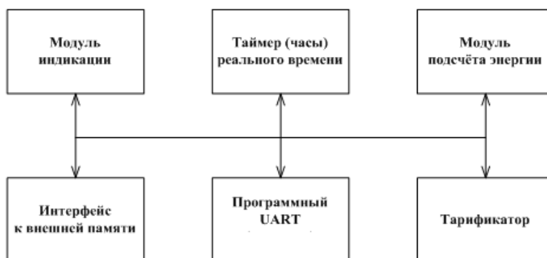
Рисунок 7 - Структура программного обеспечения «Меркурий 231»

Уровень защиты программного обеспечения «высокий» в соответствии с Р 50.2.077-2014.