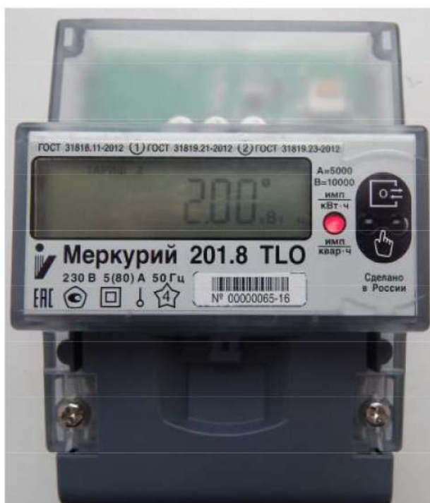
Рисунок 1 - Общий вид счётчиков «Меркурий 201.8TLO»

На рисунке 1 приведена фотография общего вида счётчиков «Меркурий 201.8TLO».