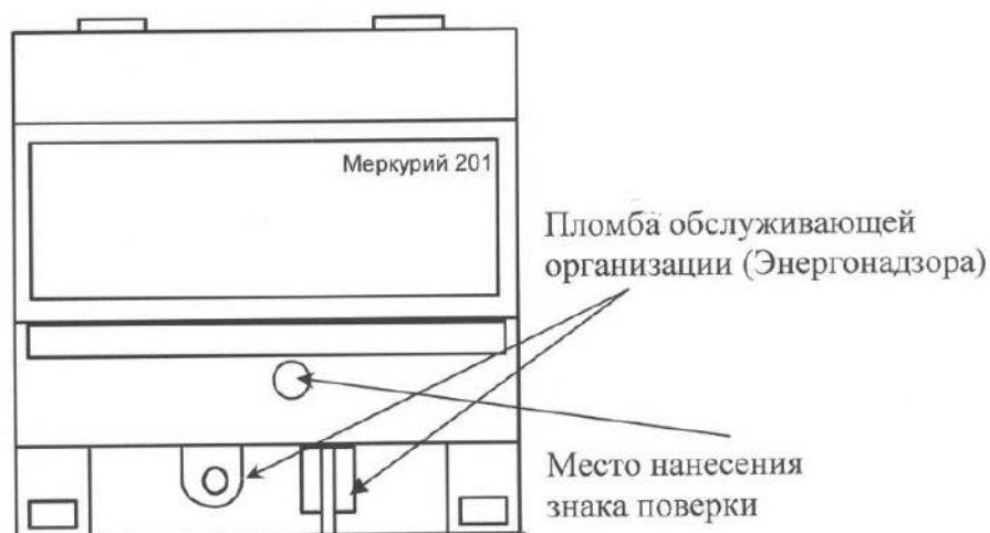
Рисунок 6 - Схема пломбировки от несанкционированного доступа, обозначение места нанесения знака поверки счётчиков «Меркурий 201.1», «Меркурий 201.2», «Меркурий 201.22», «Меркурий 201.3», «Меркурий 201.4», «Меркурий 201.42», «Меркурий 201.5», «Меркурий 201.6»