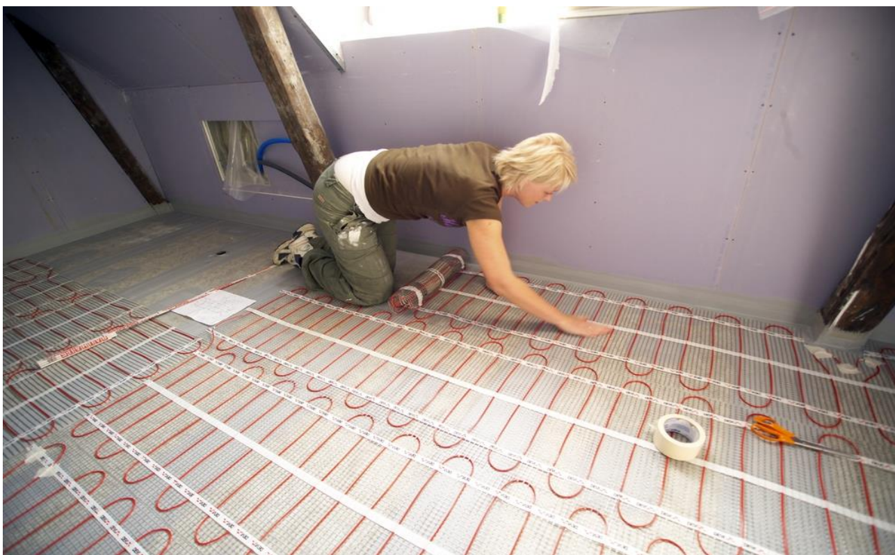
Рис. 3. Монтаж нагревательного мата DEVIheat™ 150S (DSVF-150) на основание из плит ГВЛ под плитку.

При выборе нагревательных матов необходимо учитывать допустимый разброс параметров, приведенных в технических характеристиках, и возможные отклонения напряжения питающей сети.