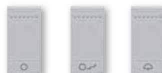
NT4915AN NT4915BN NT4915DN