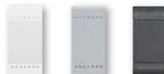
N4915N NT4915N L4915N

ПРИМЕЧАНИЕ: данные клавиши предназначены для комплектации выключателей без клавиш.