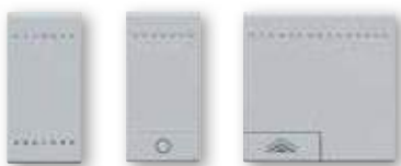
NT4915N NT4915AN NT4915M2ADN