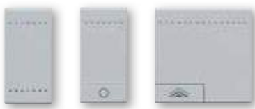
NT4915N NT4915AN NT4915M2ADN