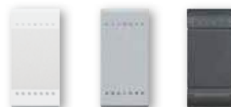
N4915N NT4915N L4915N

ПРИМЕЧАНИЕ: данные клавиши предназначены для комплектации выключателей без клавиш.