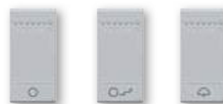
NT4915AN NT4915BN NT4915DN