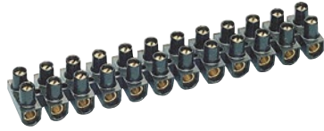
0 342 19