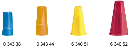
0 343 38