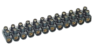
0 342 17