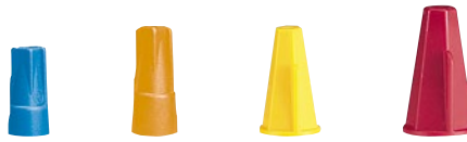
0 343 38