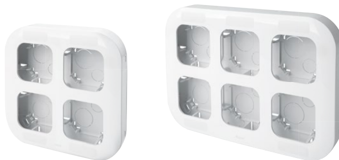
7 822 94