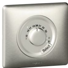
0 674 00 (Титан)