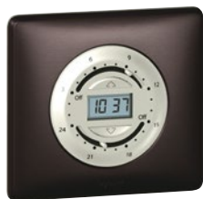
0 676 21 (Графит)