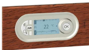
0 674 02 (Орех)