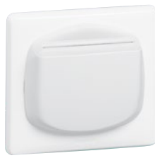
0 675 64 (Белый)