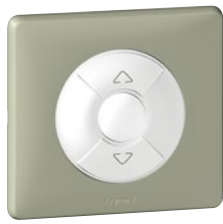
0 676 02 (Сафари)