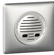
0 675 41 (Алюминий)