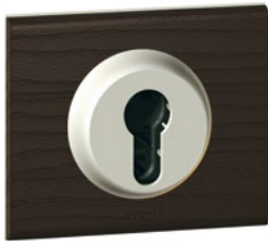
670 09 (Венге)