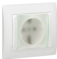
7 759 24 White

Механизмы с металлическим суппортом, монтаж на захватах или на винтах, поставляются в комплекте с белой лицевой панелью. Для установки в коробках для скрытого монтажа Ø60 мм с защитой IP 44