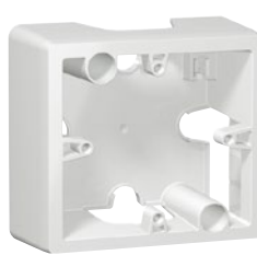
7 710 96