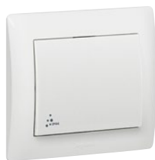
7 758 52 White