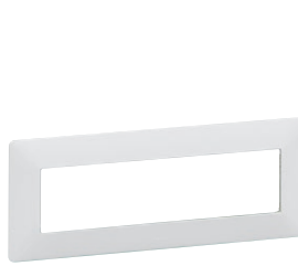
7 521 45