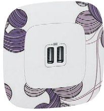
7 549 95 + 7 543 61

Механизмы Valena In'Matic поставляются с суппортом для монтажа на захватах или винтах. Степень защиты IP2X. Упакованы в профессиональную упаковку (кроме зарядного устройства Valena Life с 2 USB разъемами – в индивидуальной упаковке)