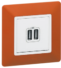
7 534 12 + 7 540 71