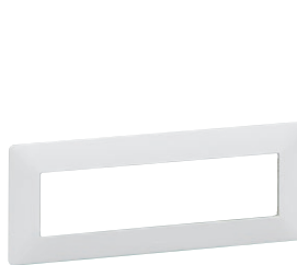
7 521 45