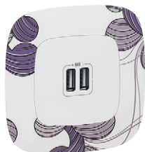
7 549 95 + 7 543 61

Механизмы Valena In'Matic поставляются с суппортом для монтажа на захватах или винтах. Степень защиты IP2X. Упакованы в профессиональную упаковку (кроме зарядного устройства Valena Life с 2 USB разъемами – в индивидуальной упаковке)