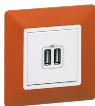
7 534 12 + 7 540 71