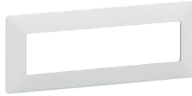
7 521 45