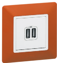
7 534 12 + 7 540 71