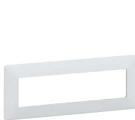
7 521 45