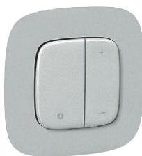
7 520 67 + 7 520 87 + 7 543 91