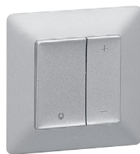
7 520 62 + 7 548 92 + 7 541 37

Механизмы Valena In'Matic поставляются с суппортами для монтажа на захватах или винтах и прозрачными крышками для защиты от загрязнений. Используются с лицевыми панелями и рамками Valena Life и Valena Allure. Упакованы в профессиональную упаковку.