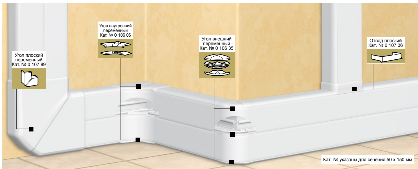
Кат. № указаны для сечения 50 x 150 мм

комплект «профиль + крышка + несущая перегородка»