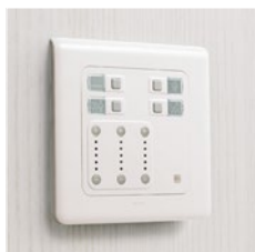
Контроллер управления освещением

Более 200 усовершенствованных функций, позволяющих потребителю оборудовать офис и организовать рабочие места.