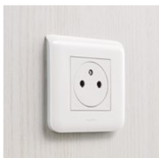
Специальная гигиеничная розетка 2К + 3