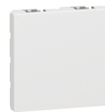
0 770 71