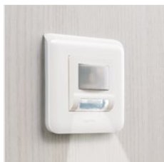
Индикатор подсветки препятствий