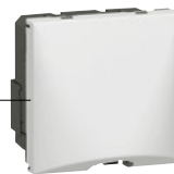
0 775 51