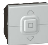
0 792 25