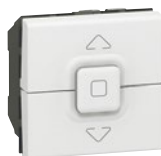
0 770 26