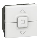
0 770 26