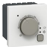
0 767 20

отопление, вентиляция, регулировка температуры