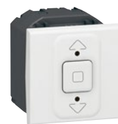
0 770 24

Подключение безвинтовыми зажимами без применения инструмента