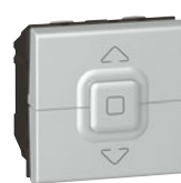
0 792 25