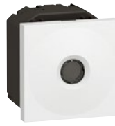
0 766 66