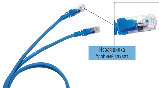
0 517 62