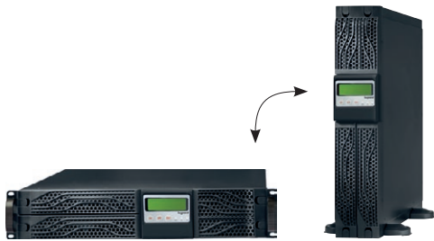
3 100 46 с поворотным ЖК-дисплеем

Для нескольких рабочих станций, серверов, коммутаторов/маршрутизаторов, модемов, компьютерных сетей Защита от перенапряжения, перегрузок и коротких замыканий Выход сигнала синусоидальной формы Поворотный ЖК-дисплей (поворот на 1/4 оборота) Варианты установки: напольное исполнение установка в телекоммуникационную стойку глубиной 800 или 1000 мм с полкой или направляющих для установки в стойку (опция) Встроенный слот для установки интерфейсного модуля (опция), обеспечивающего подключение к сети Ethernet Усовершенствованная система управления разрядом батареи Функция самодиагностики Встроенный электронный стабилизатор напряжения AVR Коэффициент мощности: 0,9 Функция холодного пуска Микропроцессорное управление Защита телефонной линии и линии Интернета RJ11/RJ45 Возможность дистанционной защиты оборудования или систем с помощью внутреннего сетевого интерфейса, Кат. № 3 108 82 Обеспечивает дистанционное аварийное отключение (EPO) Примечание: время автономной работы выражено в минутах и может изменяться в зависимости от характеристик нагрузки, условий использования и окружающей среды