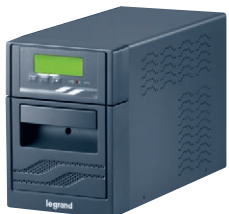
3 100 06

Для нескольких рабочих станций, серверов, коммутаторов/маршрутизаторов, модемов, компьютерных сетей и другого оборудования Защита от перенапряжения, перегрузок и коротких замыканий Выход сигнала синусоидальной формы ЖК-дисплей Усовершенствованная система управления разрядом батарей Функция самодиагностики Встроенный электронный стабилизатор напряжения AVR Функция холодного пуска Микропроцессорное управление Защита телефонной линии и линии Интернета RJ11/RJ45 Примечание: время автономной работы выражено в минутах и может изменяться в зависимости от характеристик нагрузки, условий использования и окружающей среды