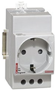
0 042 85