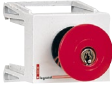
0 044 06 Пример установки: выключатели, индикаторы