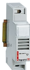
0 041 13