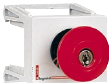
0 044 06 Пример установки: выключатели, индикаторы