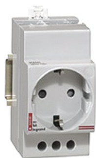
0 042 85