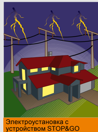
Электроустановка с устройством STOP&GO

Прекращение электроснабжения в результате воздействия временного электрического возмущения Питание электроаппаратов отсутствует