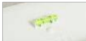
Монтажный уровень в корпусах на 18, 24 и 36 модулей