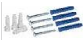
Пластиковые винты, дюбели