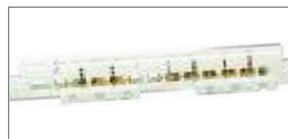
Шины N/PE, суппорт для шин N/PE