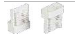
Держатели DIN-рейки ступенчатого типа