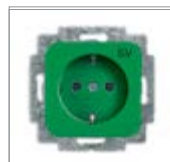
Механизм розетки SCHUKO® с маркировкой с безвинтовыми клеммами 2 P + E цветная маркировка центральной платы и цоколя Номинальное напряжение: 250 В перем. тока Номинальный ток: 16 А