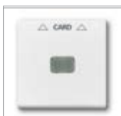
Накладка 1) для карточного выключателя для механизма 2025 U подходит для карт размером 54 x 86 мм паз для карты может подсвечиваться