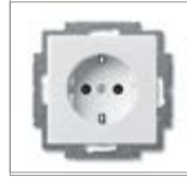
Механизм розетки SCHUKO® 1) с безвинтовыми клеммами 2 P + E Номинальное напряжение: 250 В перем. тока Номинальный ток: 16 А