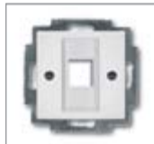
Накладка с металлической монтажной пластиной Для модульного разъема 1 м Подходит для арт. № 0210, 0211 и 0219-101 Без лапок