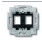
Суппорт 1) с черным цоколем

для MTRJ или 2-х разъемов Modular Jack Для систем: Ackermann, AMP / tyco Electronics (серии Slim Line (SL): 110Connect Jacks, Toolless Jacks / Standard 110Connect Jacks), Brand-Rex, CombiNet, EFB Electronic, Telena. Для 2 модулей LWL системы: AMP/tyco Electronics MTRJ Размер: (ШхВ) ок. 14,8 x 20,4 мм. без распорок