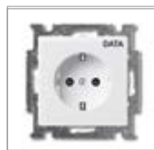
Механизм розетки SCHUKO® 1) 2) с маркировкой "DATA" с безвинтовыми клеммами 2 P + E Номинальное напряжение: 250 В перем. тока Номинальный ток: 16 А