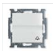
Выключатель без фиксации с клавишей с полем для надписи и символом звонок 1 полюс с N-клеммой Вторичное напряжение: 250 В пост. тока Номинальный ток: 10 А IEC 60669-1