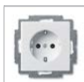
Механизм розетки SCHUKO® 1) с защитными шторками с безвинтовыми клеммами 2 P + E Номинальное напряжение: 250 В перем. тока Номинальный ток: 16 А