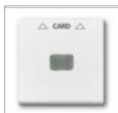
Накладка 1) для карточного выключателя для механизма 2025 U подходит для карт размером 54 x 86 мм паз для карты может подсвечиваться