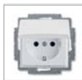
Механизм розетки SCHUKO® с крышкой с безвинтовыми клеммами 2 P + E с откидной крышкой (фиксируется в открытом положении) Номинальное напряжение: 250 В перем. тока Номинальный ток: 16 А