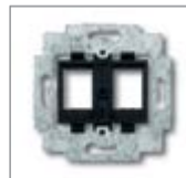
Суппорт 1) с черным цоколем

для MTRJ или 2-х разъемов Modular Jack Для систем: Ackermann, AMP / tyco Electronics (серии Slim Line (SL): 110Connect Jacks, Toolless Jacks / Standard 110Connect Jacks), Brand-Rex, CombiNet, EFB Electronic, Telena. Для 2 модулей LWL системы: AMP/tyco Electronics MTRJ Размер: (ШхВ) ок. 14,8 x 20,4 мм. без распорок