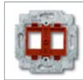
Суппорт 1) с красным цоколем

для 2-х разъемов Modular Jack Подходит к арт. № 0210, 0211 и 0219-101. Для систем: AMP / tyco Electronics, BTR, EFB, Krone, Panduit, Quante, Radiall, Setec, д-ра тех. наук Зигера (Sieger), Telena, Thomas & Betts. Для AMJ- / UMJ-модулей подключения / соединительных устройств Telegärtner. Для 2 модулей LWL системы: 3M-Volition, Krone, mvk Размер: (ШхВ) ок. 14,8 x 19,4 мм. без распорок