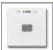
Накладка 1) для карточного выключателя для механизма 2025 U подходит для карт размером 54 x 86 мм паз для карты может подсвечиваться