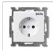
Механизм розетки SCHUKO® 1) с маркировкой "DATA" с безвинтовыми клеммами 2 P + E Номинальное напряжение: 250 В перем. тока Номинальный ток: 16 А