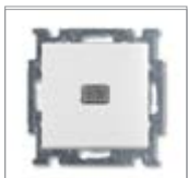
Выключатель без фиксации с клавишей и нейтральным символом 1) 1 полюс, нормально-открытый контакт с N-клеммой Номинальное напряжение: 250 В перем. тока Номинальный ток: 10 А IEC 60669-1