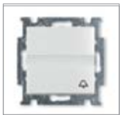
Выключатель без фиксации с клавишей с полем для надписи и символом звонка 1 полюс с N-клеммой Вторичное напряжение: 250 В пост. тока Номинальный ток: 10 А IEC 60669-1