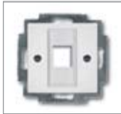
Накладка с металлической монтажной пластиной Для модульного разъема 1 м Подходит для арт. № 0210, 0211 и 0219-101 Без лапок