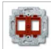
Суппорт 1) с красным цоколем

1) Совместимость с другими производителями разъемов, не включенных в список компаний, подбираются в соответствии с указанными размерами.