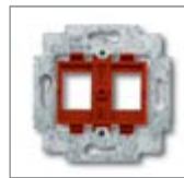
Суппорт 1) с красным цоколем

для 2-х разъемов Modular Jack Подходит к арт. № 0210, 0211 и 0219-101. Для систем: AMP / tyco Electronics, BTR, EFB, Krone, Panduit, Quante, Radiall, Setec, д-ра тех. наук Зигера (Sieger), Telena, Thomas & Betts. Для AMJ- / UMJ-модулей подключения / соединительных устройств Telegärtner. Для 2 модулей LWL системы: 3M-Volition, Krone, mvk Размер: (ШхВ) ок. 14,8 x 19,4 мм. без распорок