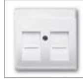
Накладка со шторками, для 2-х разъемов Modular Jack только для суппортов 1810, 1812, 1814, 1816, 1818, 1819 и 1820.