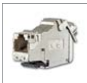
Универсальный модуль, RJ45, кат. 6A iso, экранированный 1) 1 разъем, 8(8) полюсов

Для монтажа в монтажном адаптере 0219/12 или 0219/13. Также подходит для монтажа на центральной плате 2561 и в цоколе 1812, 1866 EB и 1867 EB. Подключения RJ-45 для сетей кат. 6A, класса EA (10 Гбит/с / 500 МГц). Соответствует кат. 6A, классу EA согласно ISO/IEC 11801:2011-06. Кат. 6A согласно ISO/IEC 11801: 2011-06. Маркировка подключений А и В согласно TIA/EIA-568-B.2. Модель соответствует EN 60 603-7-51:2011-01. Экранирование в соответствии с DIN EN 55022, класс В. Подходит для PoE+ согласно IEEE 802.3at, ≥ 1000 ци-клов вставки. Прокладка кабеля по оптимальному радиусу (30°). Возможно заземление корпуса с помощью 6,3-милли-метрового плоского штекерного соединителя с тыльной стороны. Испытано после повторного монтажа. Подходит для смешения и подгонки только для 8-полюсного штекера RJ 45 Корпус из цинкового сплава, отлитого под давлением. Встроенный пылезащитный колпачок (по запросу съёмный). Клеммы. Для кабеля для передачи данных, диаметр 6 - 10 мм. Для жил AWG 24-22. Для монтажа в кабельных каналах, монтажных коробках с/у и подпольных системах.