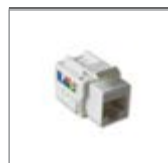
Вставка с модульным разъемом

Кат. 5е неэкранированный, 8 (8)-полюсный Для накладки 2561- и вставки 1812, 1866 встроено, 1867 встроено Для проводников с поперечным сечением от 0,12 мм 2 (AWG 26) до 0,35 мм 2 (AWG 22)