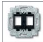
Суппорт 1) с черным цоколем

для MTRJ или 2-х разъемов Modular Jack Для систем: Ackermann, AMP / tyco Electronics (серии Slim Line (SL): 110Connect Jacks, Toolless Jacks / Standard 110Connect Jacks), Brand-Rex, CombiNet, EFB Electronic, Telena. Для 2 модулей LWL системы: AMP/tyco Electronics MTRJ Размер: (ШхВ) ок. 14,8 x 20,4 мм. без распорок