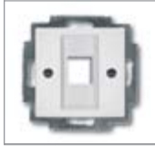
Накладка с металлической монтажной пластиной Для модульного разъема 1 м Подходит для арт. № 0210, 0211 и 0219-101 Без лапок