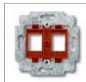
Суппорт 1) с красным цоколем