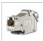
Универсальный модуль, RJ45, кат. 6A iso, экранированный 1) 1 разъем, 8(8) полюсов

Для монтажа в монтажном адаптере 0219/12 или 0219/13. Также подходит для монтажа на центральной плате 2561 и в цоколе 1812, 1866 EB и 1867 EB. Подключения RJ-45 для сетей кат. 6A, класса EA (10 Гбит/с / 500 МГц). Соответствует кат. 6A, классу EA согласно ISO/IEC 11801:2011-06. Кат. 6A согласно ISO/IEC 11801: 2011-06. Маркировка подключений А и В согласно TIA/EIA-568-B.2.