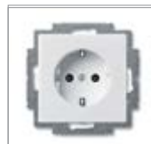
Механизм розетки SCHUKO® 1) с защитными шторками с безвинтовыми клеммами 2 P + E Номинальное напряжение: 250 В перем. тока Номинальный ток: 16 А