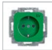
Механизм розетки SCHUKO® с маркировкой с безвинтовыми клеммами 2 P + E цветная маркировка центральной платы и цоколя Номинальное напряжение: 250 В перем. тока Номинальный ток: 16 А