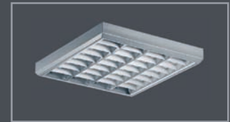
Цвет корпуса – металл